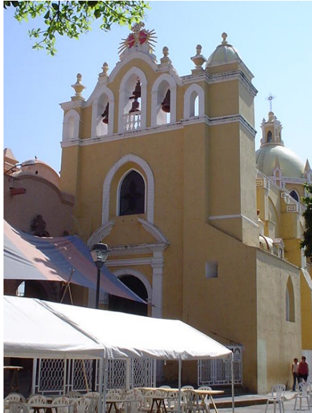
EL SAGRARIO, HUAJUAPAN