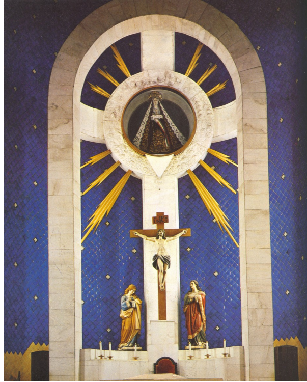
Representación de la Sangre de Cristo. Altar mayor de la Catedral de Acapulco.