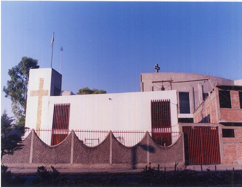
SAN FELIPE DE JESÚS IZTAPALAPA, DISTRITO FEDERAL