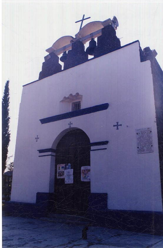
LA ASUNCIÓN, ACULCO IZTACALCO, DISTRITO FEDERAL