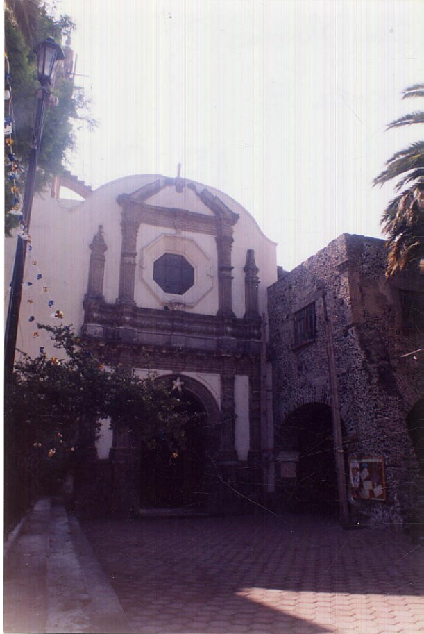
SAN MATÍAS APÓSTOL IZTACALCO, DISTRITO FEDERAL