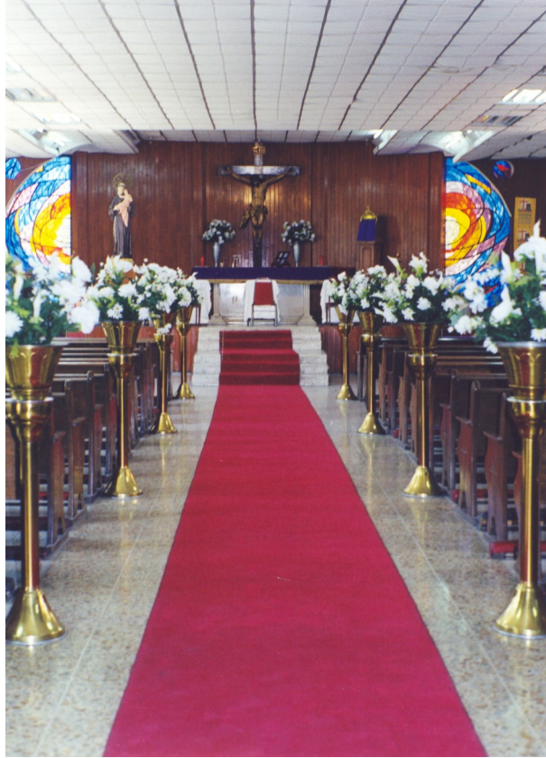
SAN ANTONIO DE PADUA IZTAPALAPA, DISTRITO FEDERAL