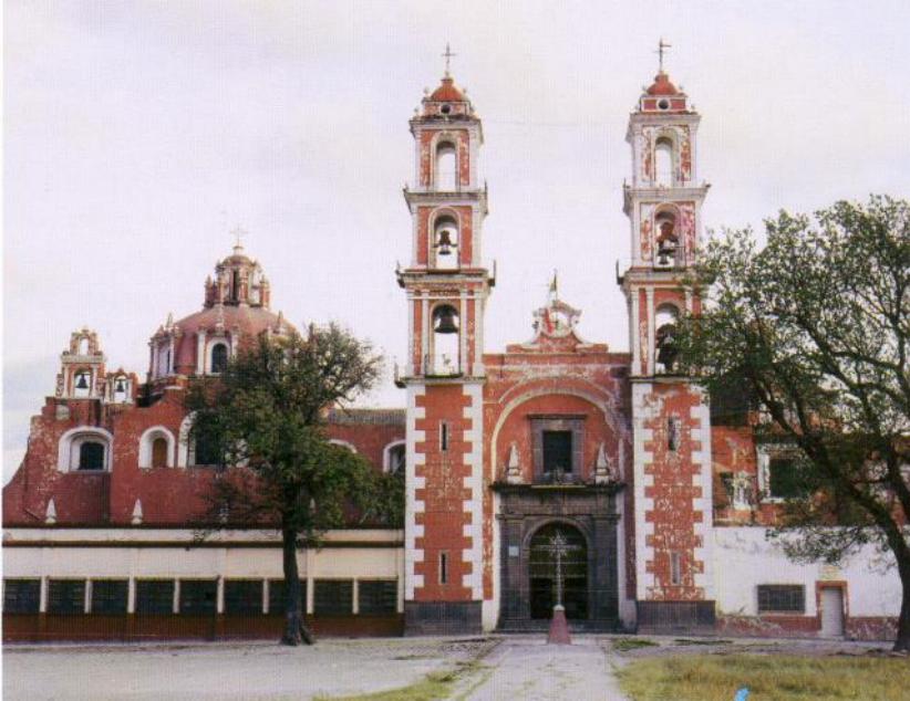
SANTO ÁNGEL CUSTODIO ARZOBISPADO DE PUEBLA ANALCO, PUEBLA