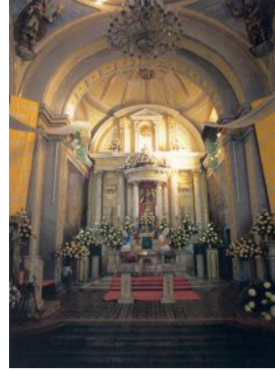
Altar de la Parroquia

El actual párroco Herculano Palacios se ha interesado en inventariar los documentos que integran el archivo parroquial consultados con frecuencia por el presbítero doctor Justino Cortés.