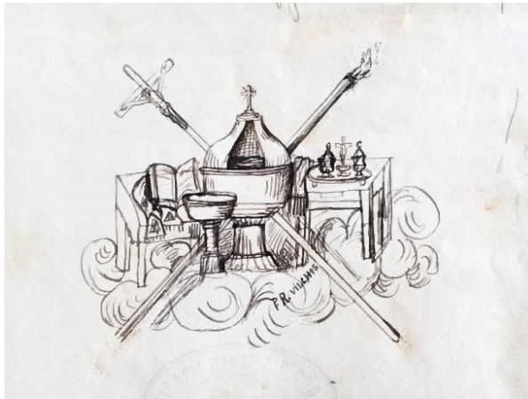
Dibujo en la portada de un libro de bautismo