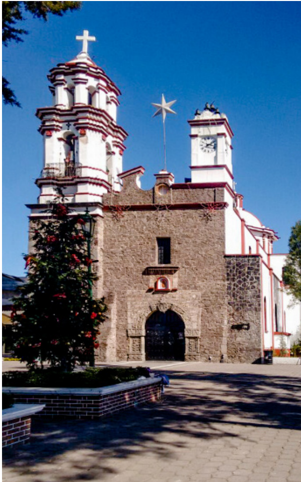
Parroquia de San Pedro Apóstol