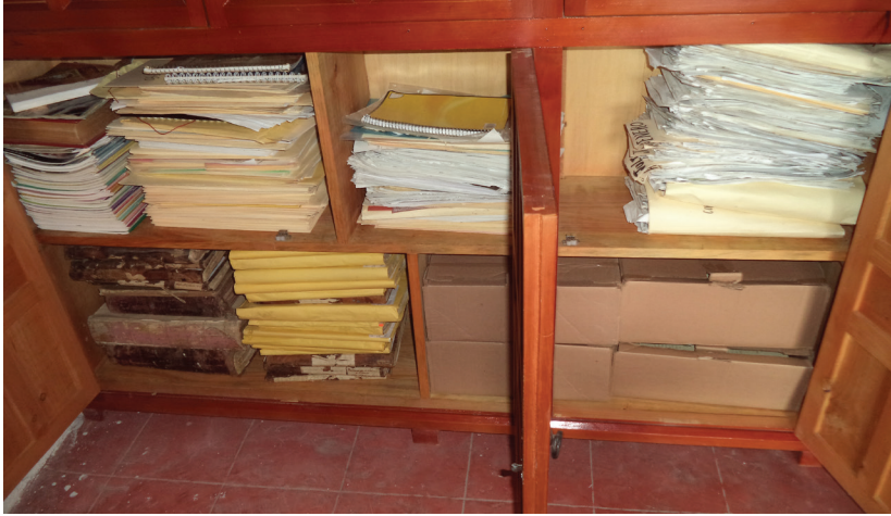
Antes del proceso