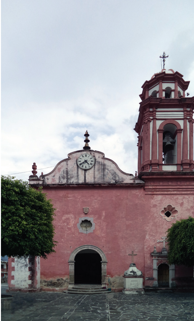
Parroquia de San Martín de Tours Acamixtla