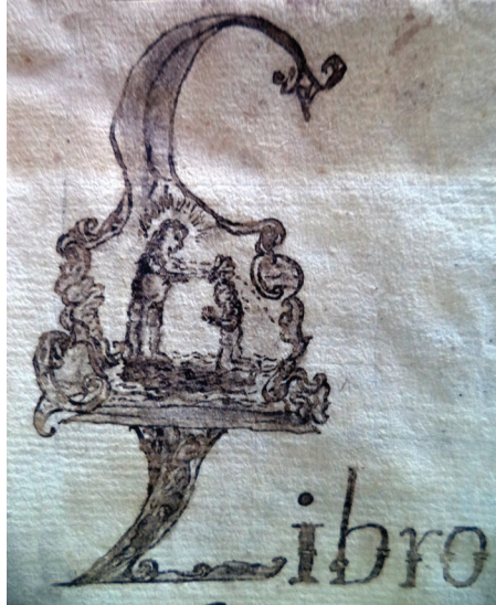
Letra capital en el libro de bautismos de 1771-1778