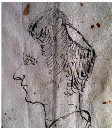
Dibujos en el libro de bautismos de 1742-1757