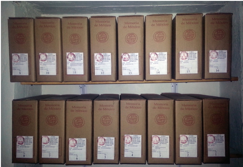
Después del proceso