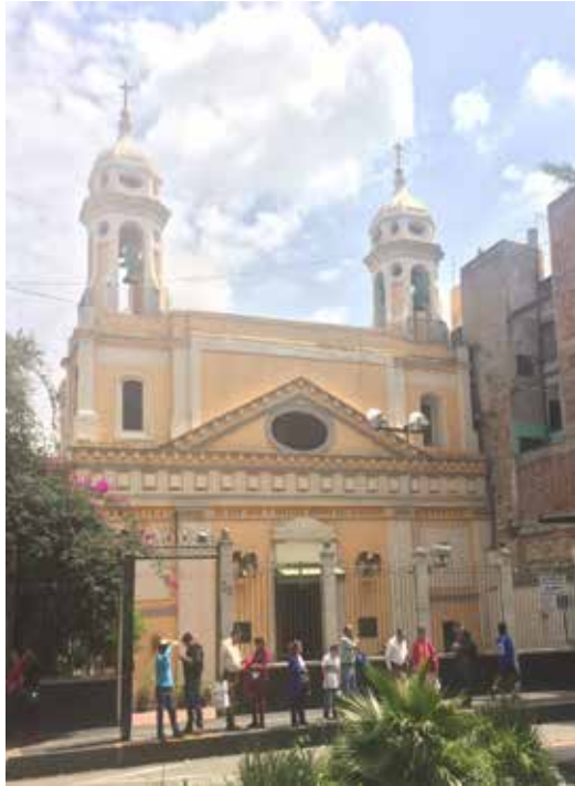
Basílica de San José y Nuestra Señora del Sagrado Corazón, Ciudad de México