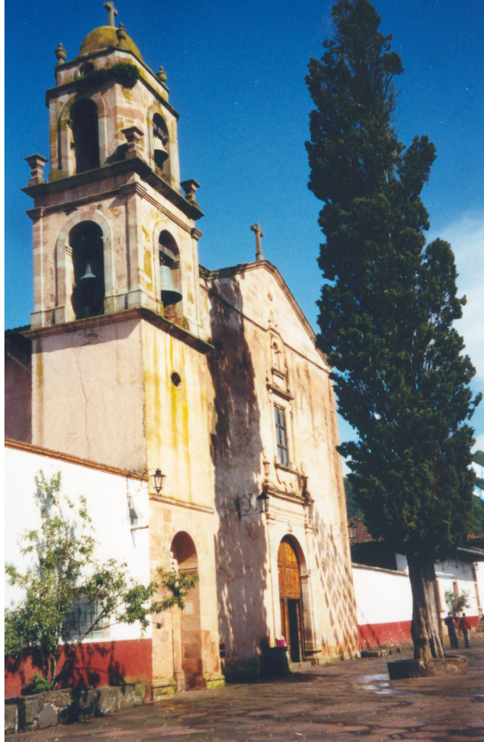
SANTA CLARA DE ASÍS DIÓCESIS DE TACÁMBARO MICHOACÁN