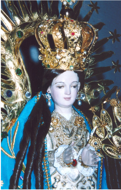
Patrona de Santa Clara del Cobre

tectónicos, “...hay iglesia de una nave, con su crucero entablado al suelo y cielo, con siete altares formales y retablos de mala escultura, piezas separadas de sacristía y pila bautismal, coro alto con órgano descompuesto y lo material de las paredes amenazando ruina igualmente que las casas curales anexas”. 1