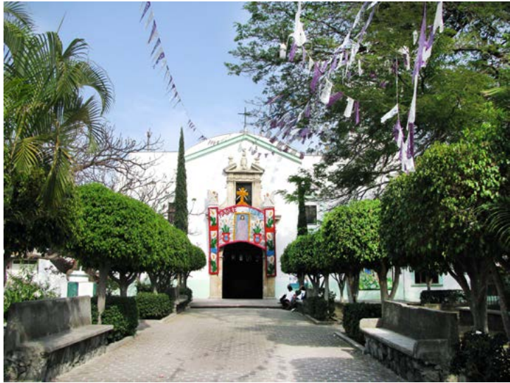
SAN CRISTÓBAL MÁRTIR TEPEOJUMA, PUEBLA