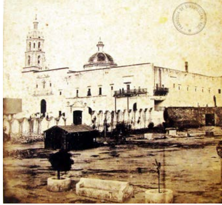
Vista de la Iglesia de San Antonio Singuilucan, 12 de mayo de 1871.

La parroquia presenta una atractiva fachada de estilo barroco sobrio, con columnas pareadas a los lados de la puerta y un hermoso nicho sobre ella, donde se aprecia un crucifijo en relieve. En su interior conserva lienzos de buena calidad con temas de la Pasión de Jesús y un altar de estilo barroco churrigueresco dedicado al santo patrono. 9