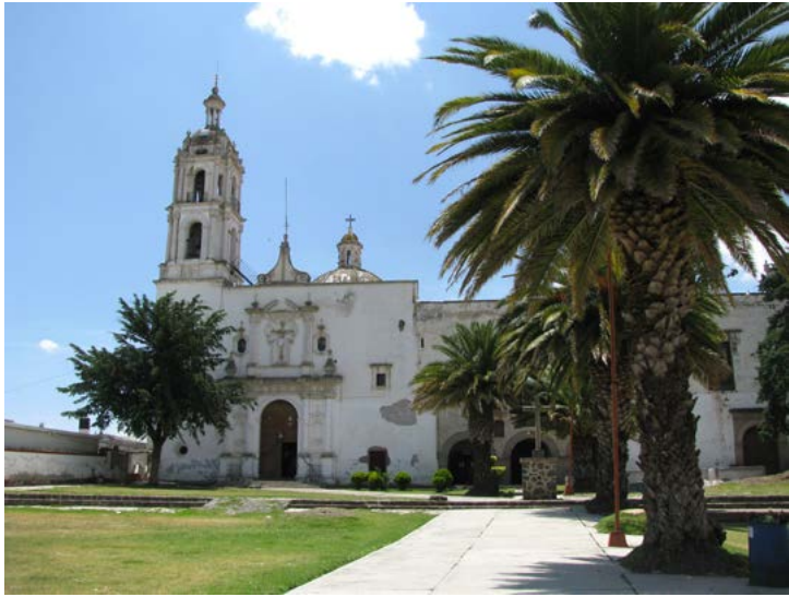
SAN ANTONIO DE PADUA, SINGUILUCAN, HIDALGO