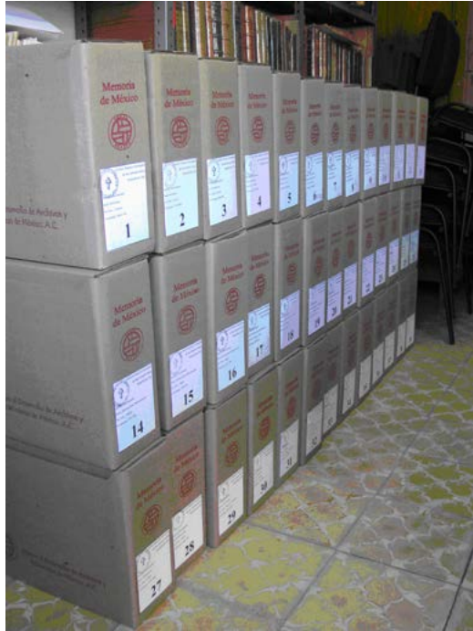
Después del proceso