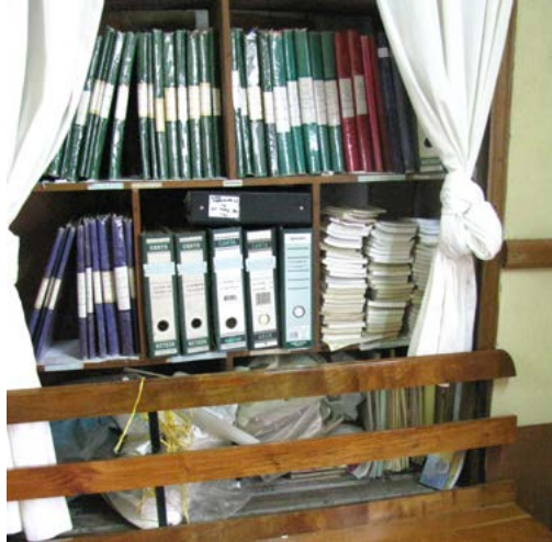
Antes del proceso