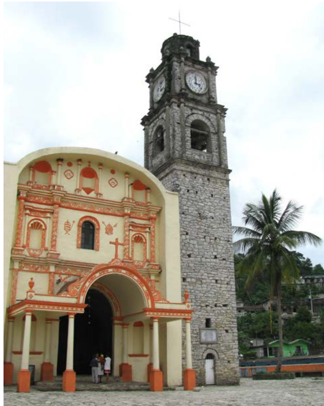
SAN FRANCISCO DE ASÍS, CAXHUACAN, PUEBLA