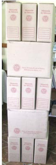
Después del proceso