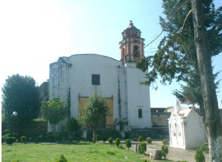
PARROQUIA DE SANTO DOMINGO DE GUZMÁN, HUEYAPAN, MORELOS