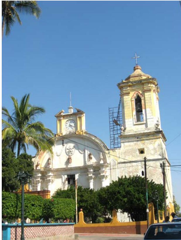
PARROQUIA DE SAN FRANCISCO DE ASÍS, TETECALA, MORELOS