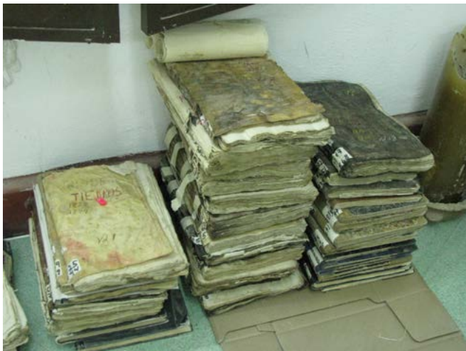
Antes del proceso