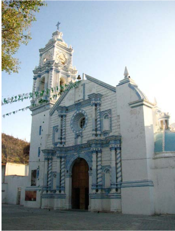
SAN MARTÍN OBISPO DE TOURS, ZAPOTITLÁN SALINAS, PUEBLA