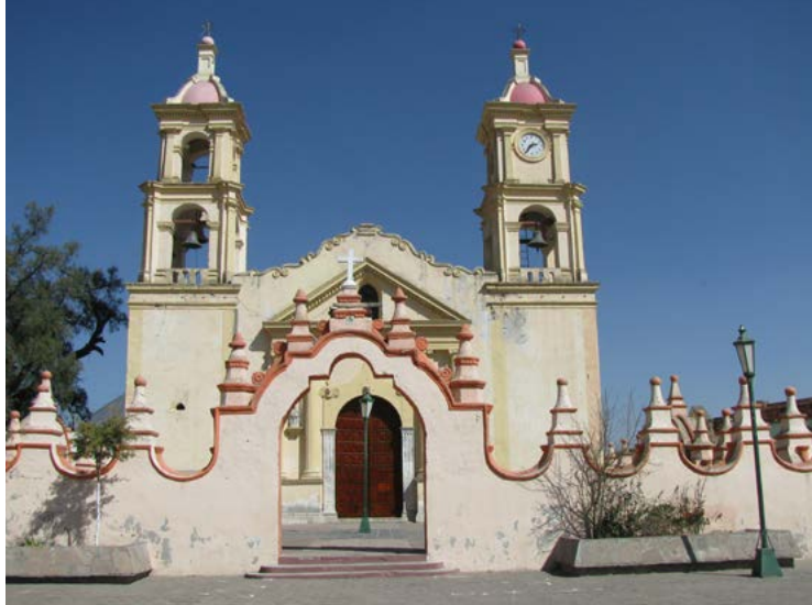
SAN PEDRO APÓSTOL, TEPEYAHUALCO, PUEBLA