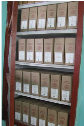
Después del proceso