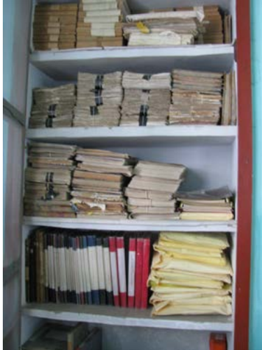
Antes del proceso