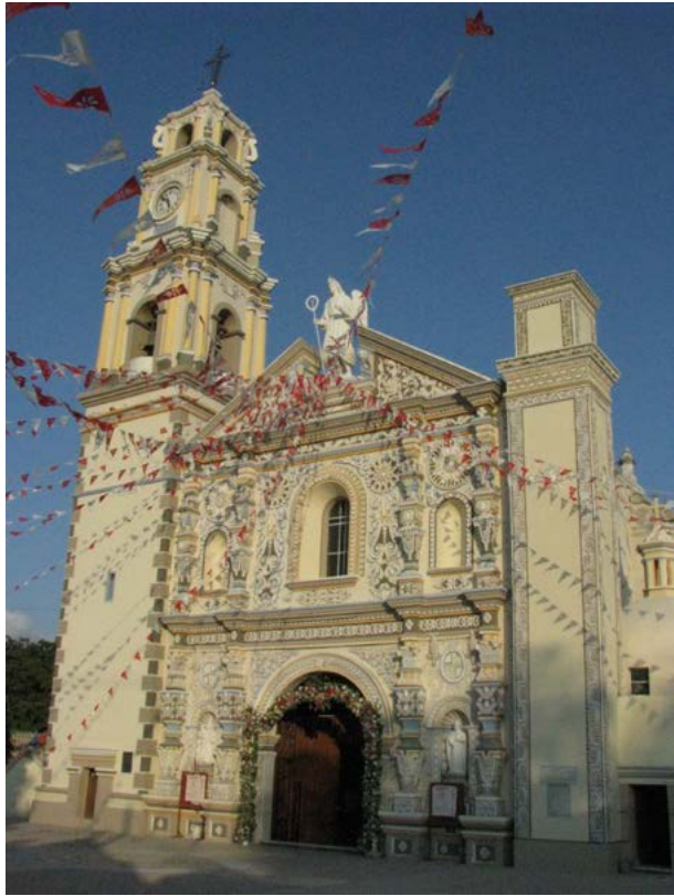
SAN GABRIEL ARCÁNGEL, CHILAC, PUEBLA