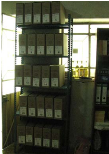
Después del proceso