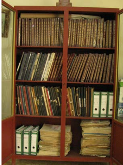
Antes del proceso