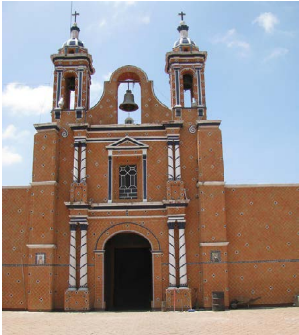
SANTA RITA TLAHUAPAN, ARZOBISPADO DE PUEBLA