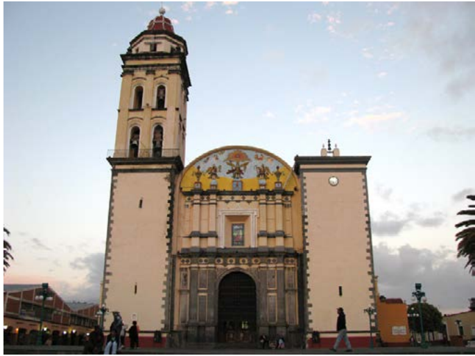
SAN ANDRÉS CHALCHICOMULA, ARZOBISPADO DE PUEBLA