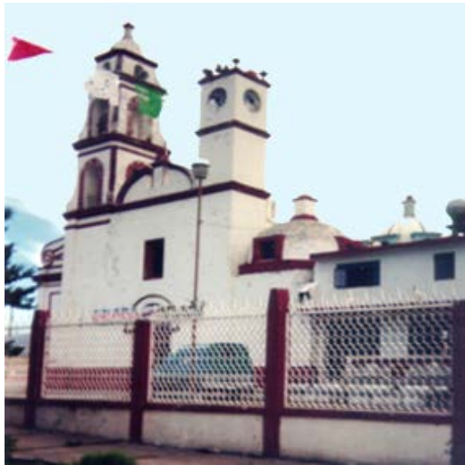
LA INMACULADA CONCEPCIÓN, TLACHICHUCA, ARZOBISPADO DE PUEBLA