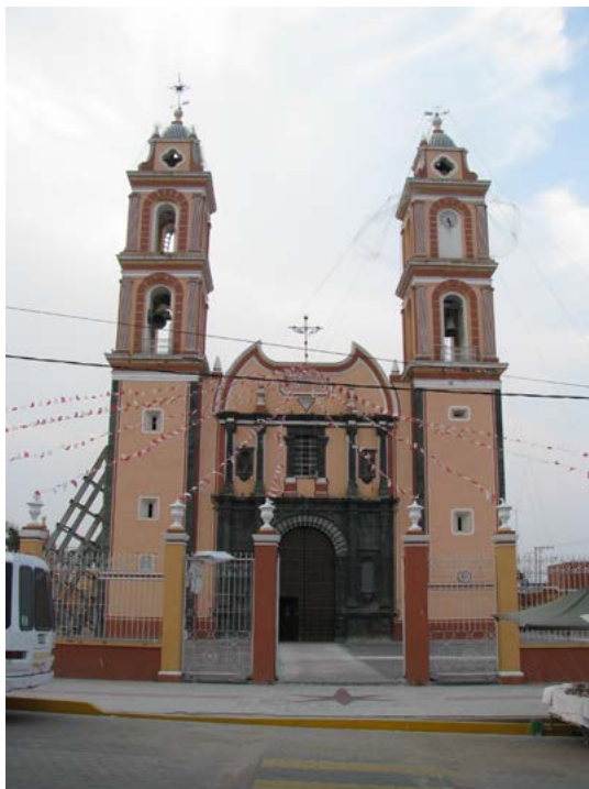
SANTA CRUZ, TLACOTEPEC DE BENITO JUÁREZ, DIÓCESIS DE TEHUACÁN, PUEBLA,