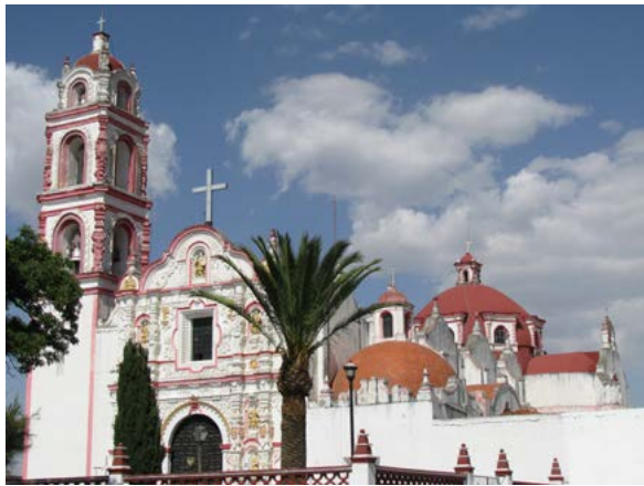
SAN JERÓNIMO ALJOJUCA, ARZOBISPADO DE PUEBLA