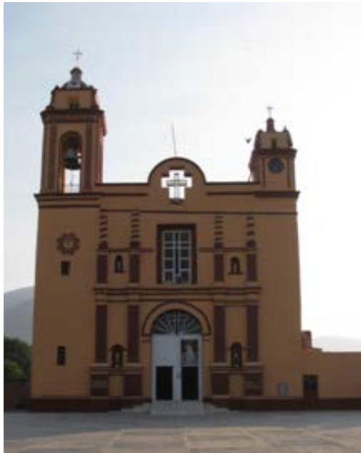
SAN SIMÓN Y SAN JUDAS TADEO, YEHUALTEPEC, PUEBLA