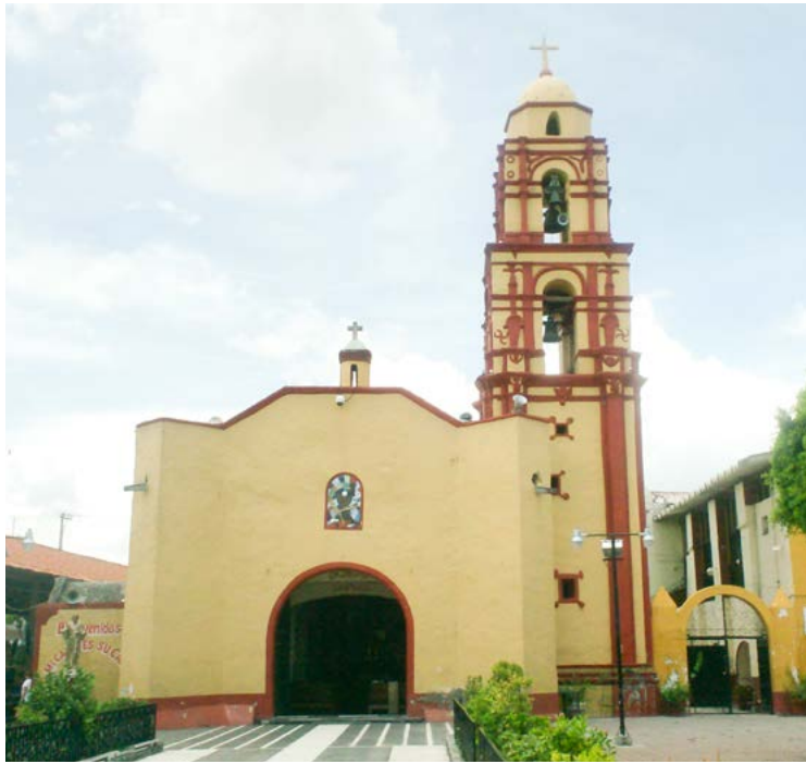
SAN PABLO APÓSTOL AXOCHIAPAN, MORELOS