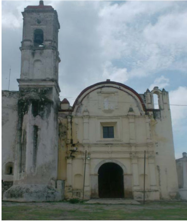
SAN AGUSTÍN JONACATEPEC, MORELOS