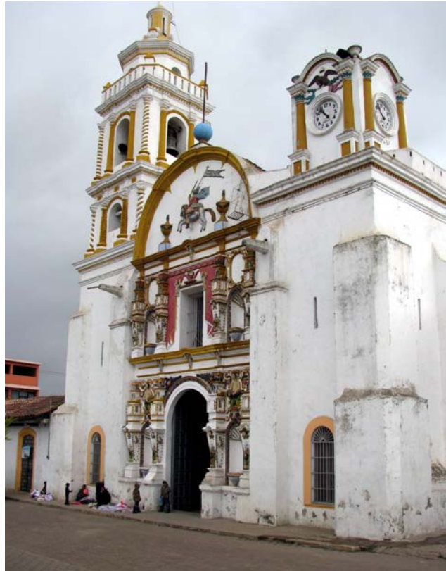
SANTIAGO APÓSTOL, CHIGNAHUAPAN PUEBLA