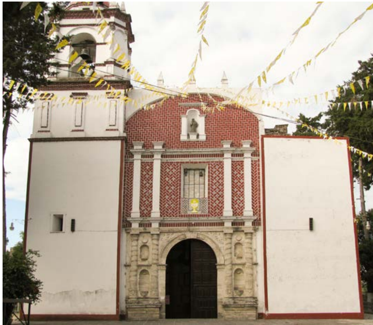
SAN FRANCISCO TOTIMEHUACÁN, PUEBLA