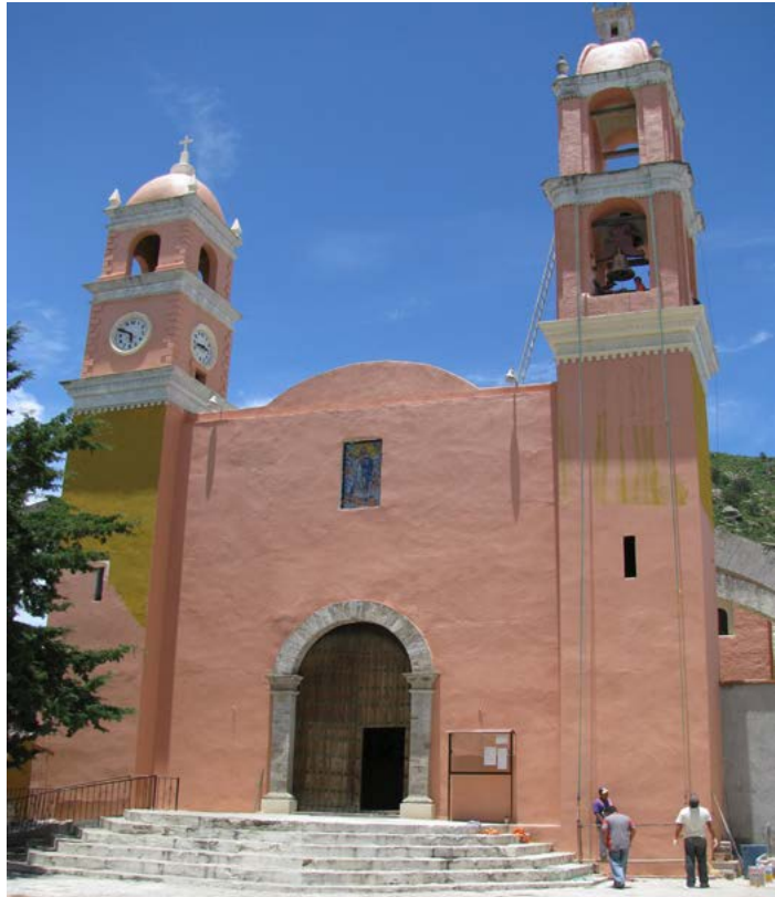
SANTA MARÍA DE LA NATIVIDAD CUYOACO, PUEBLA