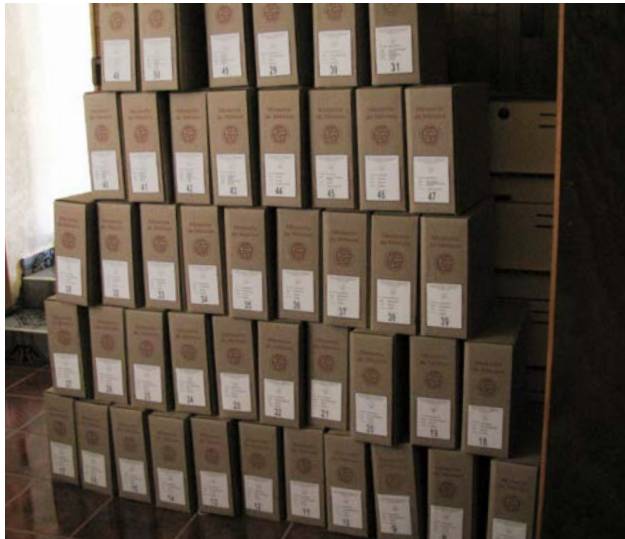
Después del proceso