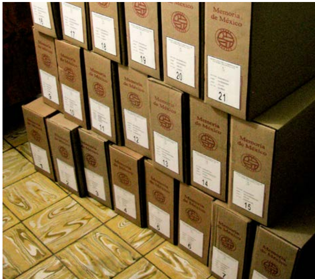
Después del proceso