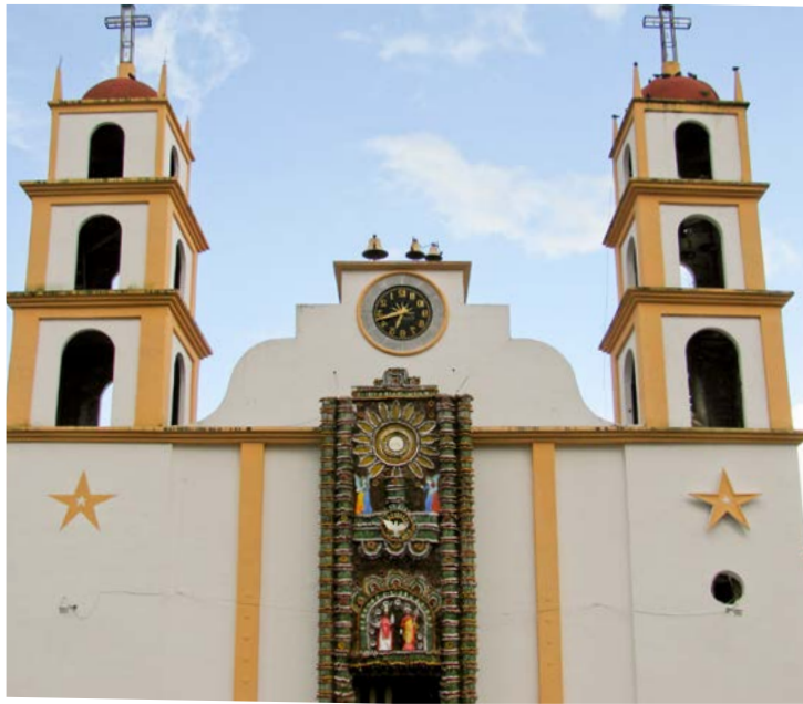
SAN PEDRO CHILCHOTLA, PUEBLA