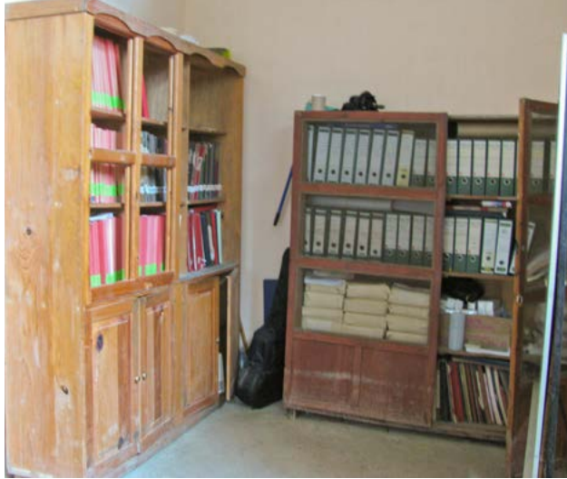
Antes del proceso