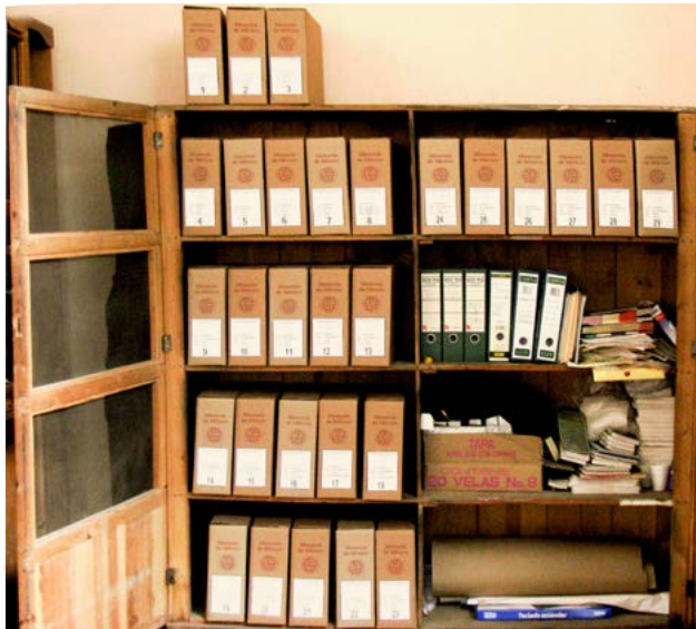
Después del proceso