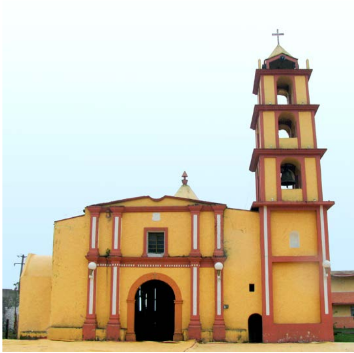
SAN MATEO CHICHQUILA, PUEBLA