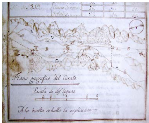
Plano del curato de Nogales, que indica la trayectoria de las cordilleras correspondiente al año de 1819. Disciplinar, Gobierno, Caja 61, 1790-1827.

El acervo está resguardado en 61 cajas AG12, colocado en estantes metálicos y ubicado en la oficina parroquial. Pese a que la localidad padece de humedad ambiental, la documentación en general se mantiene en buenas condiciones.