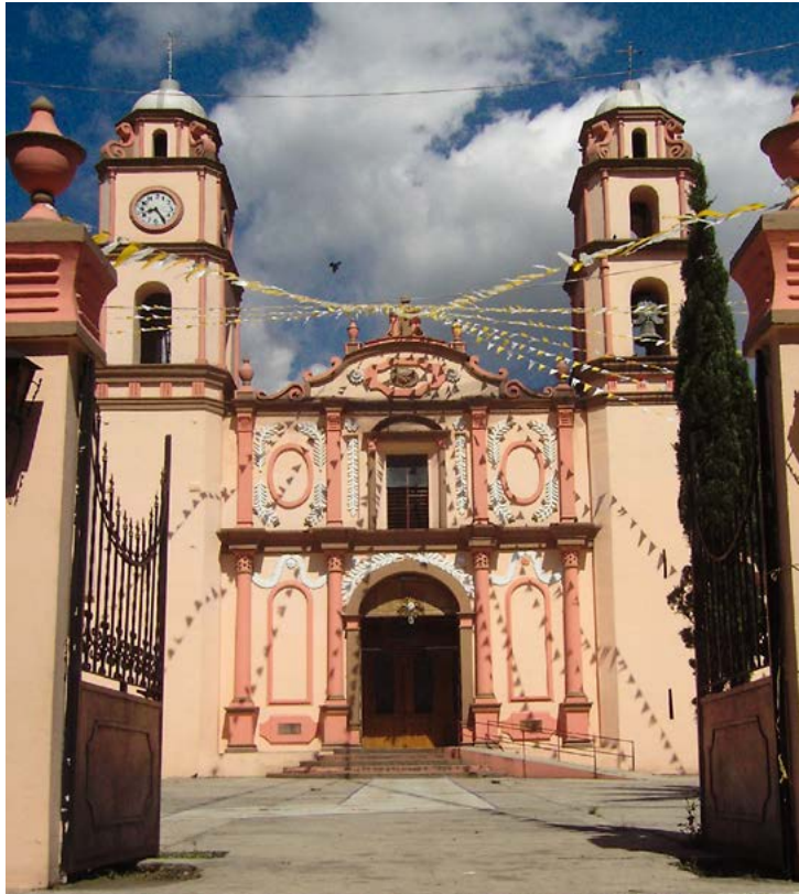
SAN JUAN BAUTISTA NOGALES, VERACRUZ