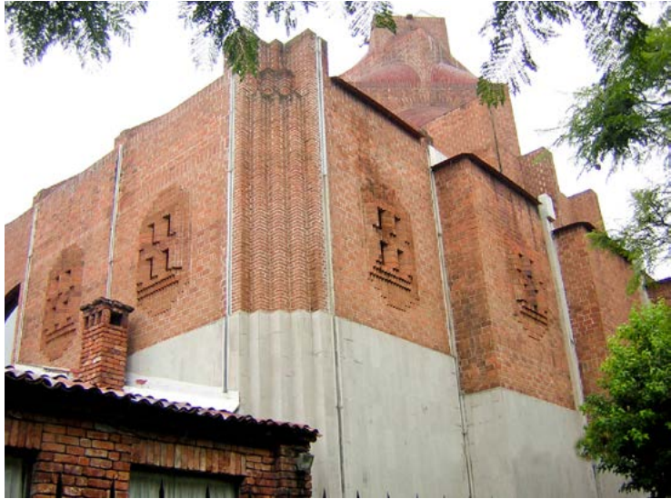
ANTIGUA CHRIST CHURCH, D.F. IGLESIA ANGLICANA DE MÉXICO