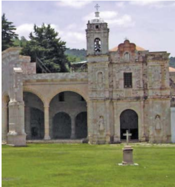
SAN PEDRO Y SAN PABLO TEPOSCOLULA