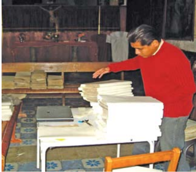
Durante el proceso