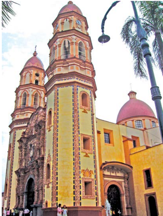
SANTA MARÍA DE GUADALUPE, LA CONCORDIA, ORIZABA