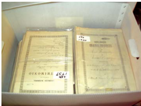
Antes del proceso