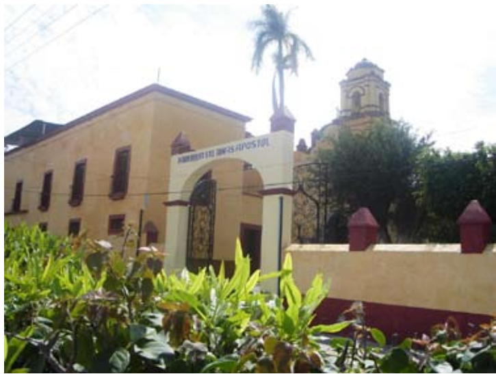
SANTO TOMÁS APÓSTOL, MIACATLÁN