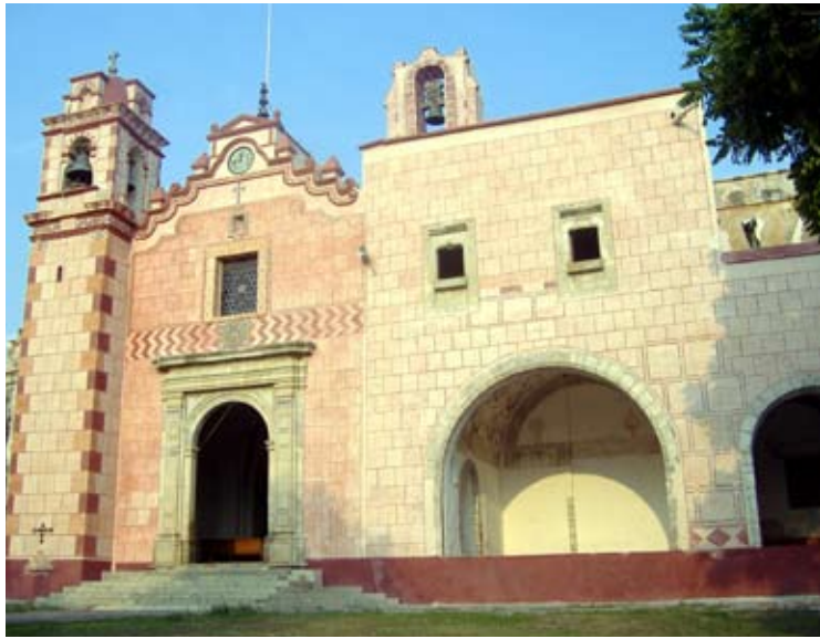
INMACULADA CONCEPCIÓN ZACUALPAN DE AMILPAS