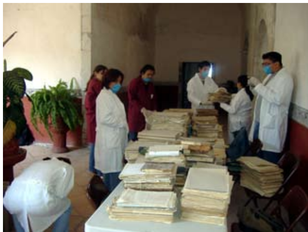
Durante el proceso