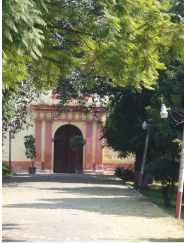
NUESTRA SEÑORA DE LA ASUNCIÓN, YAUTEPEC