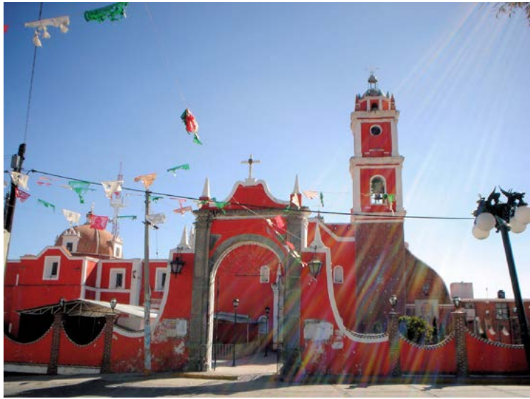
SAN FELIPE ZITLALTEPEC