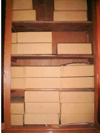
Antes del proceso