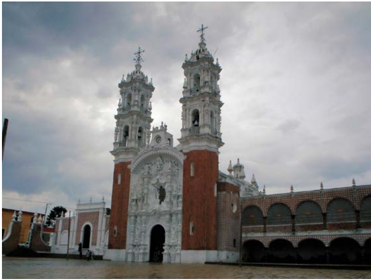
NUESTRA SEÑORA DE OCOTLÁN