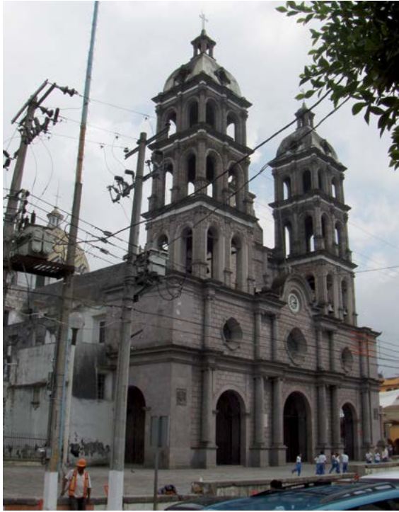
EL SAGRARIO, TEZIUTLÁN