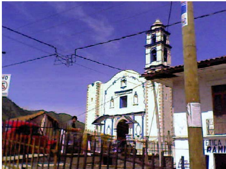
SANTA MARÍA DE LA ASUNCIÓN TETELA DE OCAMPO