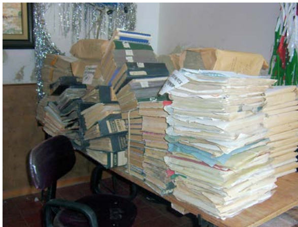
Antes del proceso