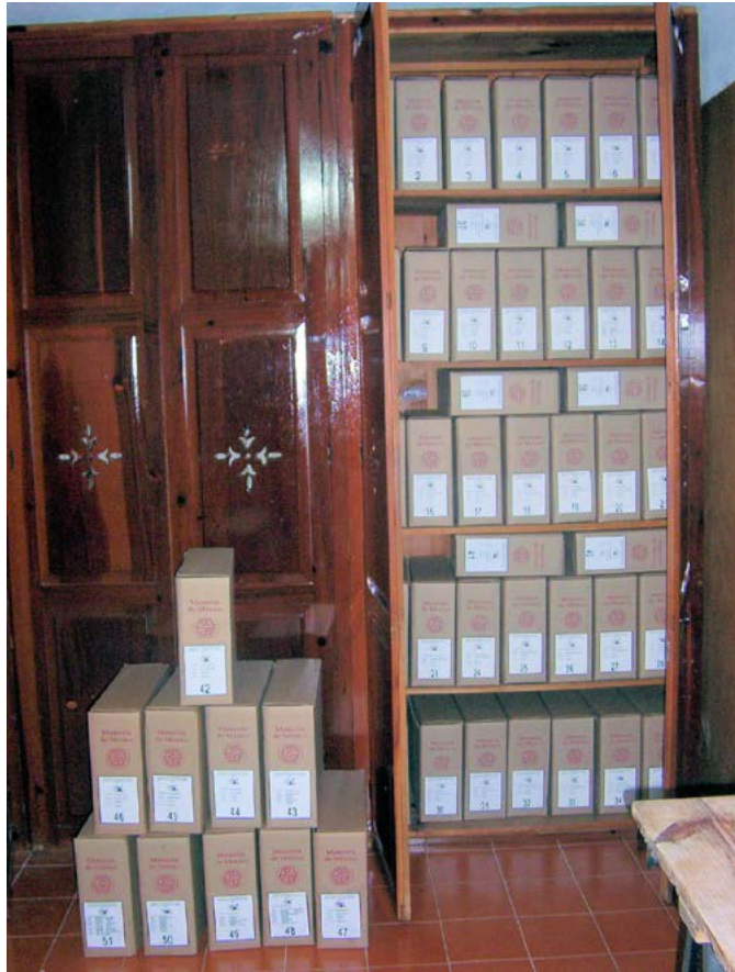
Después del proceso