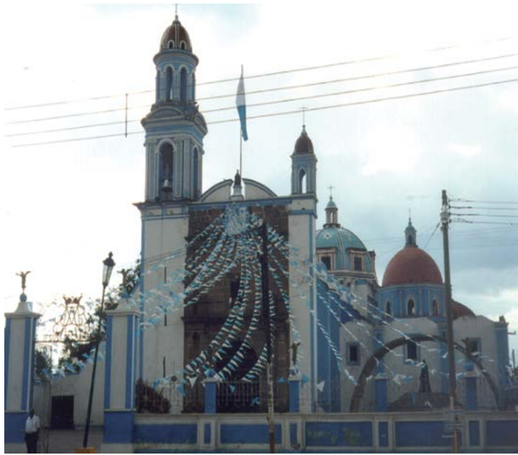
SANTA MARÍA DE LA ASUNCIÓN, AMOZOC