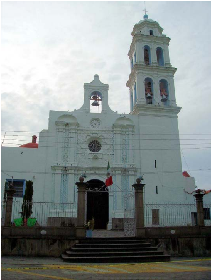
SANTA MARÍA DE LA ASUNCIÓN, IZÚCAR DE MATAMOROS