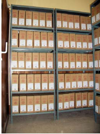
Después del proceso