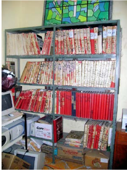
Antes del proceso