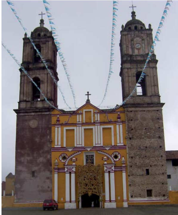
SANTA MARÍA DE LA ASUNCIÓN, TLATLAUQUITEPEC