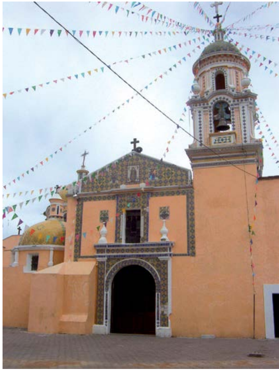
SANTA CLARA DE ASÍS, OCOYUCAN