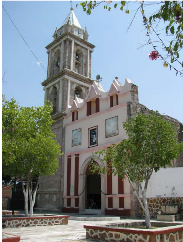
SAN NICOLÁS HUEHUETLÁN EL CHICO, PUEBLA