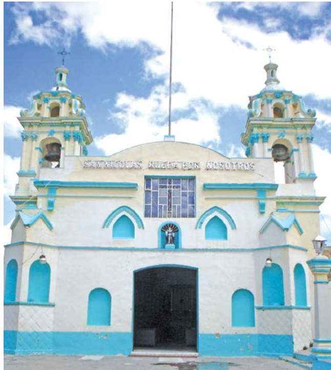
SAN NICOLÁS TOLENTINO, TERRENATE