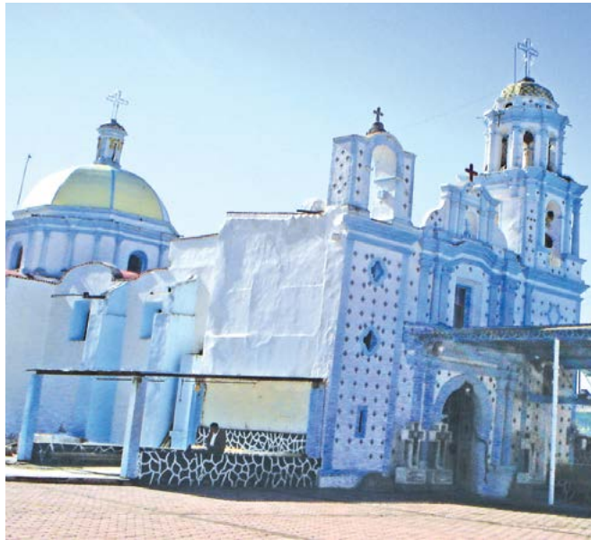
SANTA ISABEL TETLATLAHUCA