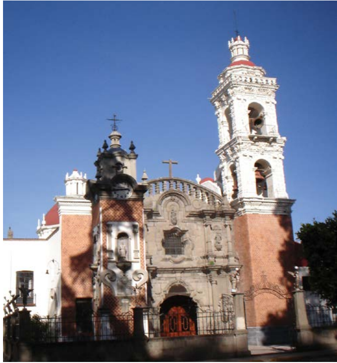
NUESTRA SEÑORA DE SANTA ANA, CHIAUTEMPAN