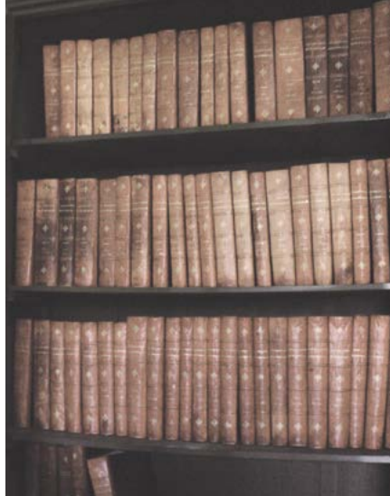
Antes del proceso