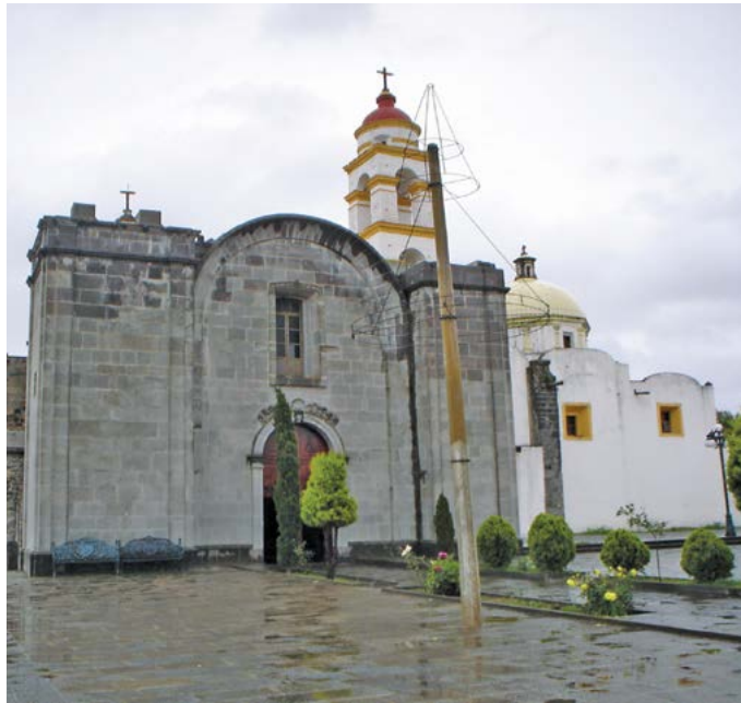
SAN MARTÍN DE TOURS, XALTOCAN