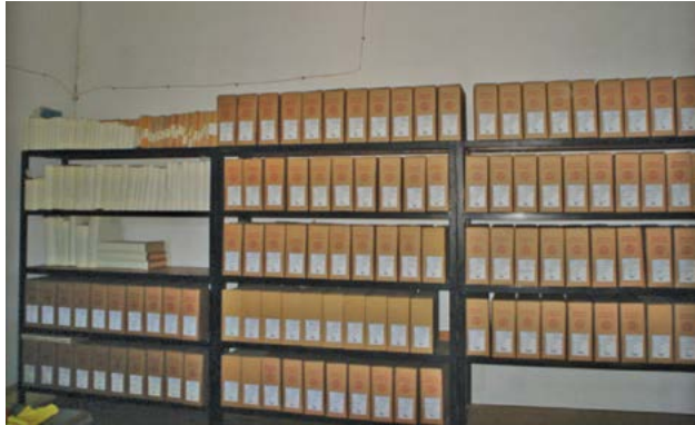
Después del proceso