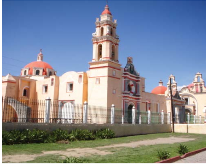
SAN FELIPE APÓSTOL, IXTACUIXTLA DE MARIANO MATAMOROS