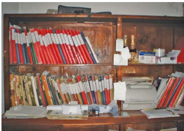
Antes del proceso