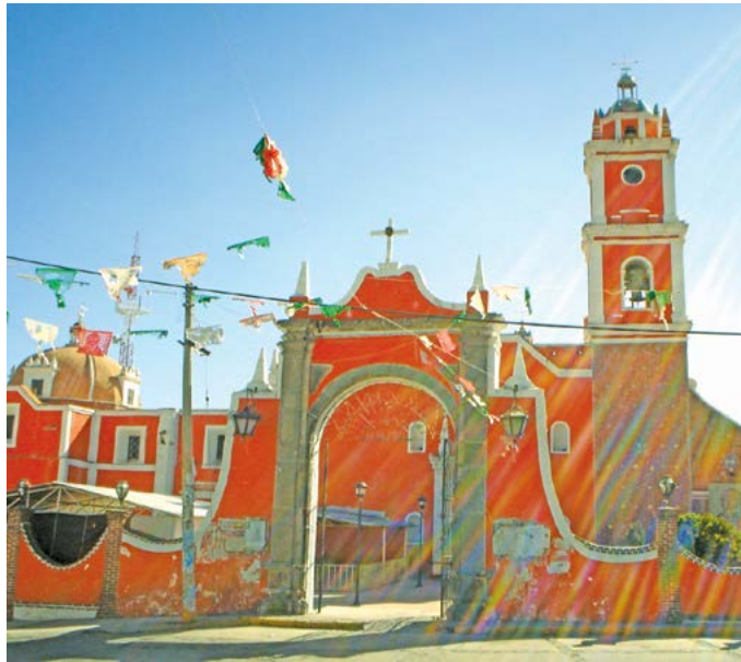
SAN PABLO APÓSTOL, ZITLALTEPEC