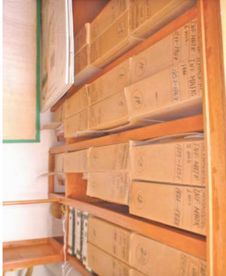
Antes del proceso